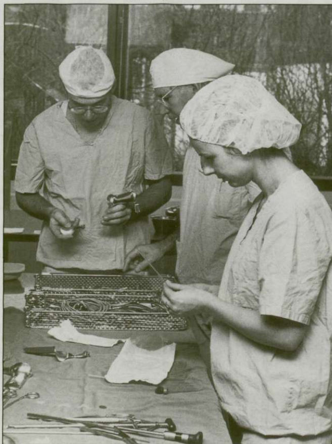
Duidelijk afgebakende taken voor iedereen...

Nu komen er vaak telefoontjes met vragen waar de spullen blijven, terwijl achteraf soms blijkt dat het gewoon ergens bij hen op de afdeling staat. Door precies te weten waar en wanneer iets is be-